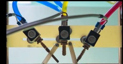
“三阀”是最难的一种拍摄形式