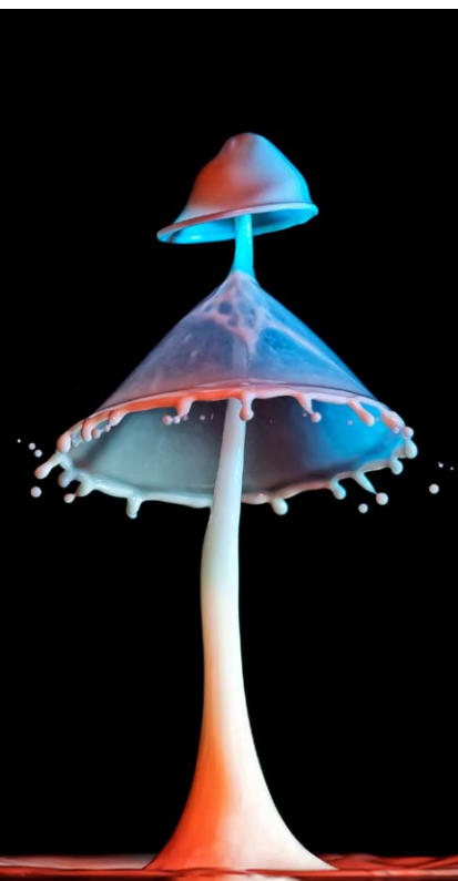
原料:水、牛奶 配料:糖、食用胶、奶油、颜料等